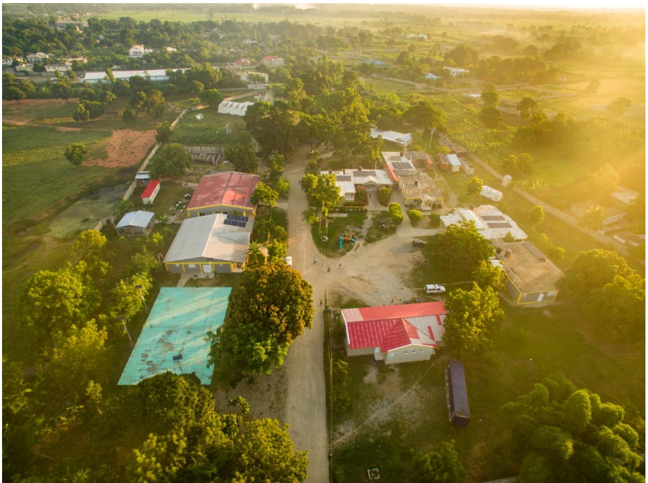
Hôpital Convention Baptiste d'Haiti